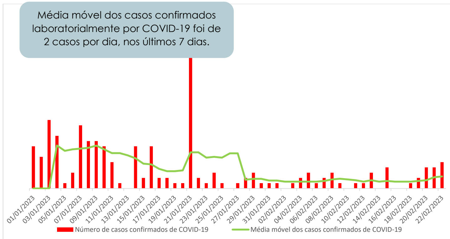
Gráfico 2 - Número de casos confirmados por COVID-19, de residentes de Ribeirão das Neves, entre 01/01/2023 a 24/02/2023.

Fonte: Planilha simplificada de dados/Vigilância Epidemiológica/Vigilância em Saúde/SMS Ribeirão das Neves. Dados atualizados em 28/02/2023 e sujeitos a alterações.