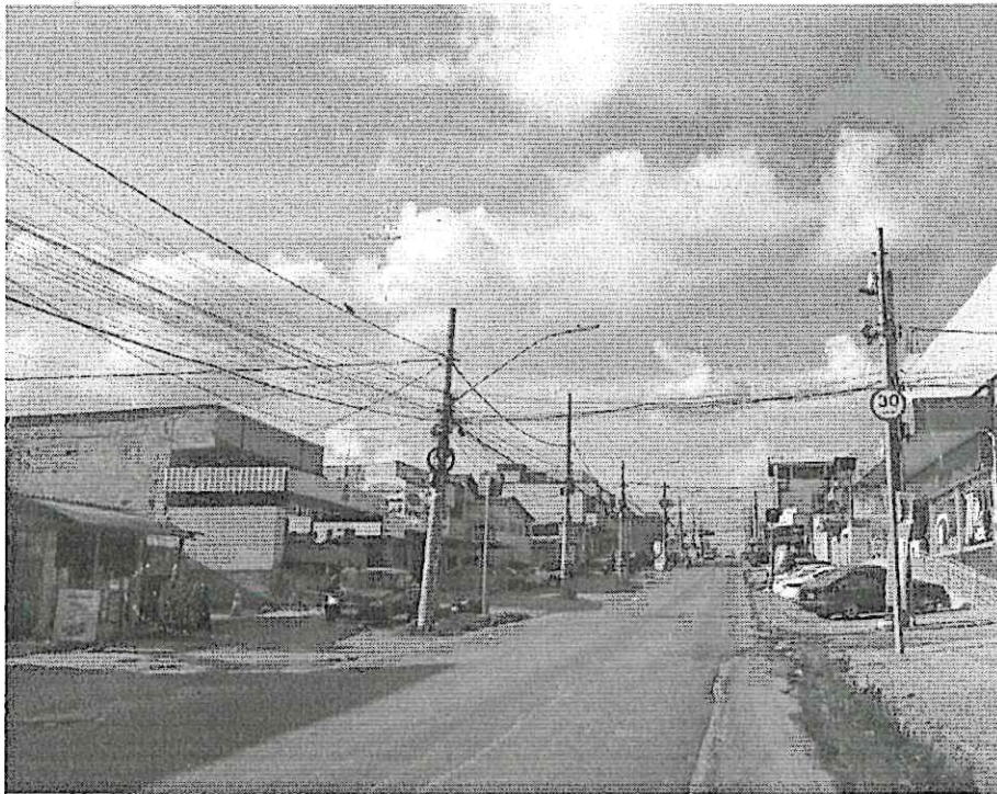
Local Fiscalizado (Esmeraldas / Ribeirão das Neves)