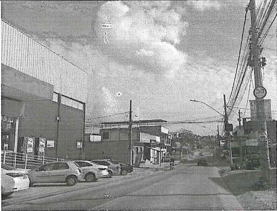
Local Fiscalizado (Ribeirão das Neves / Esmeraldas)