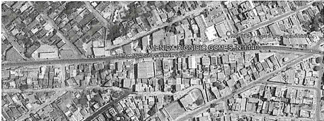
Vista Superior