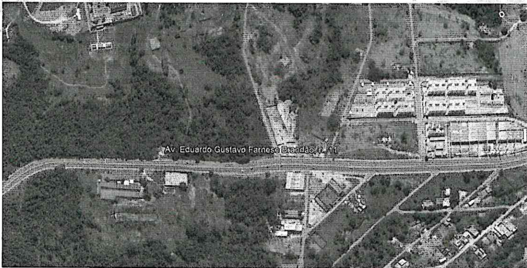
Vista Superior