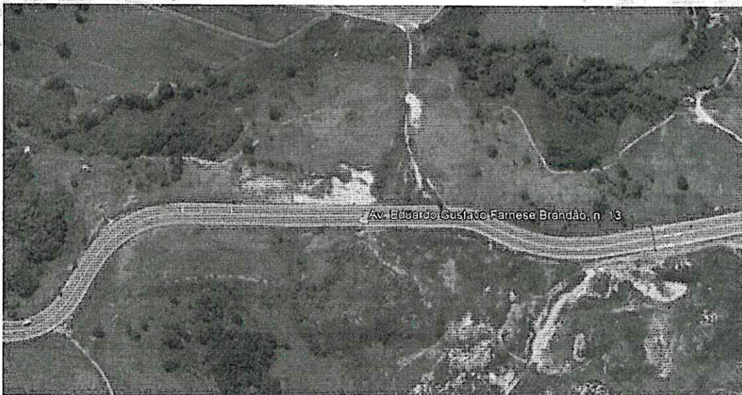
Vista Superior – Fonte: Google Earth